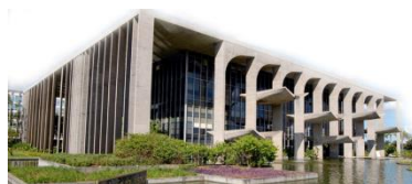
Ministério da Justiça (MJ)