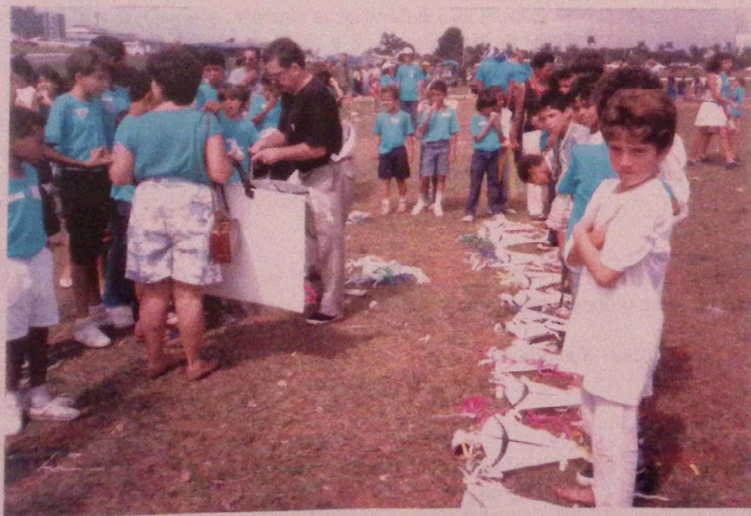
A xilo nos Aires