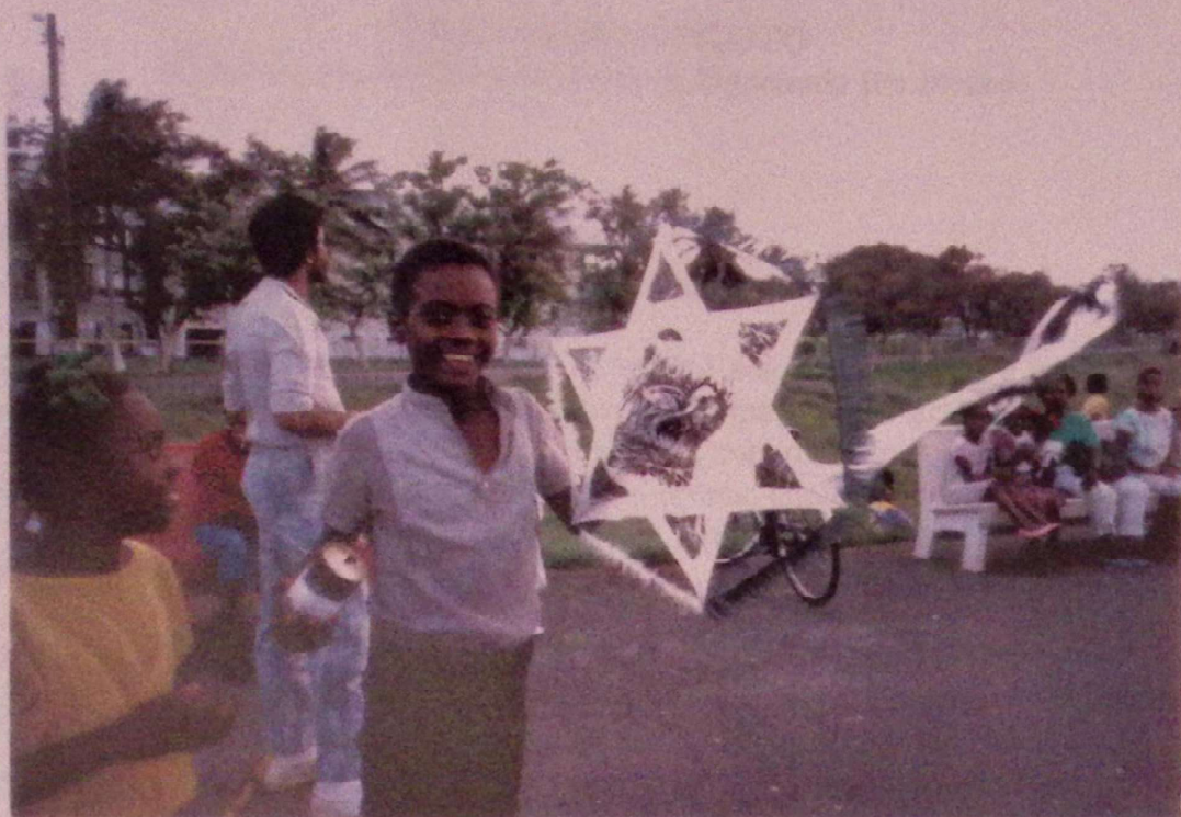
A Xilo nos Aires