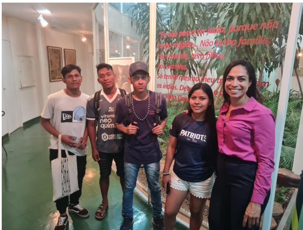
Imagem 11 – Alunos de graduação da UnB visitando a exposição

9.2 Alunos indígenas de graduação da UnB;