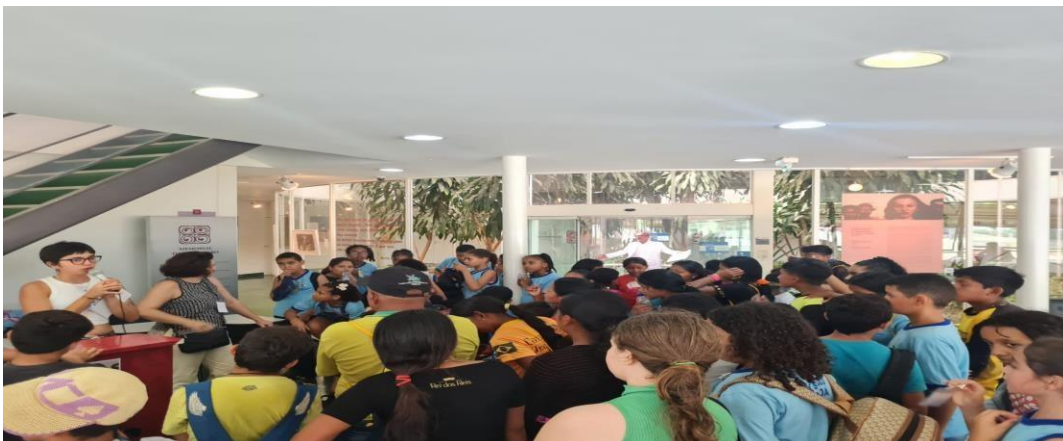
Imagem 10: Visita guiada de alunos da Escola Classe XXX, da região Café sem troco.

9.1) Escola Classe da região do Café sem Troco (65 alunos, dentre eles, alguns indígenas);