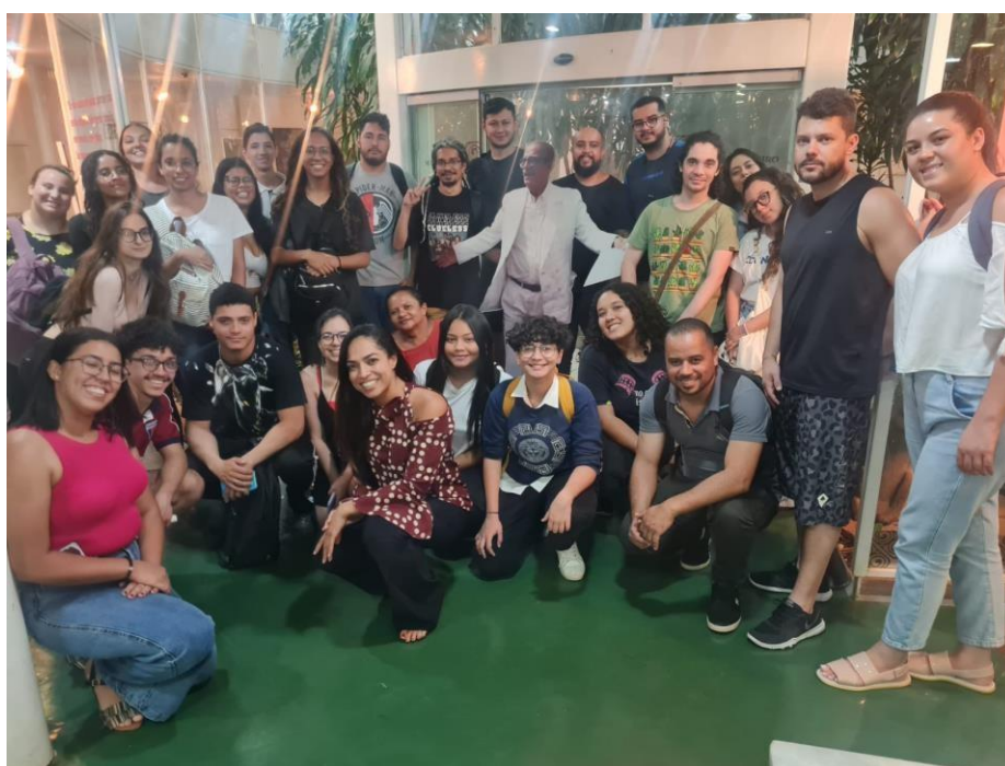
Imagem 14: Recepção de alunos do curso de Arquivologia.

9.5 Aproximadamente 30 alunos do Curso de Graduação de Arquivologia.