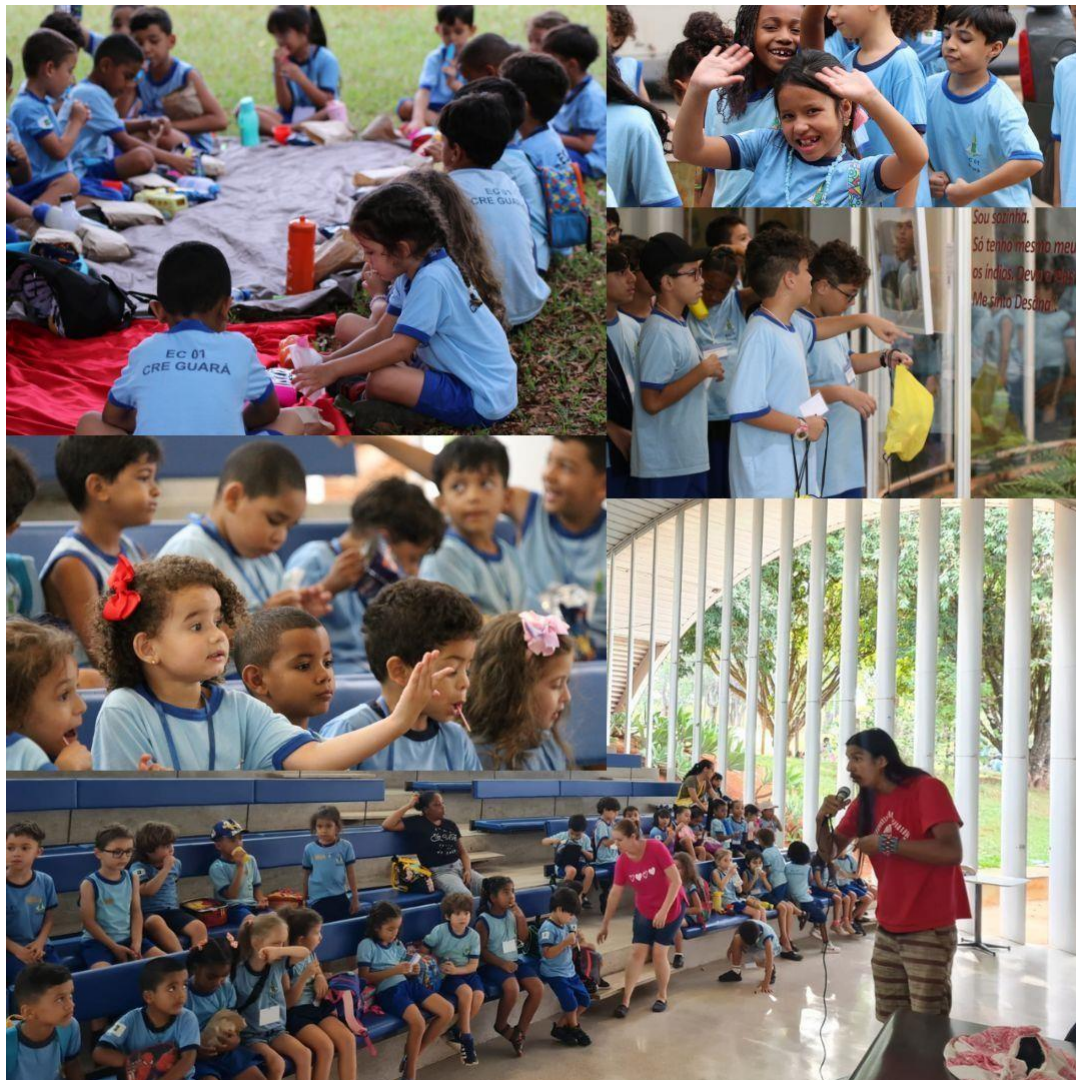
Imagem 12: Interação de alunos da Escola Classe do Guará com aluno indígena da UnB