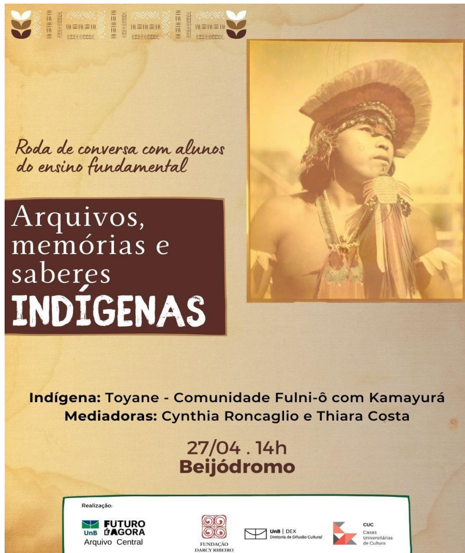
Imagem 5: Folder do evento: Arquivos, Memórias e Saberes Indígenas