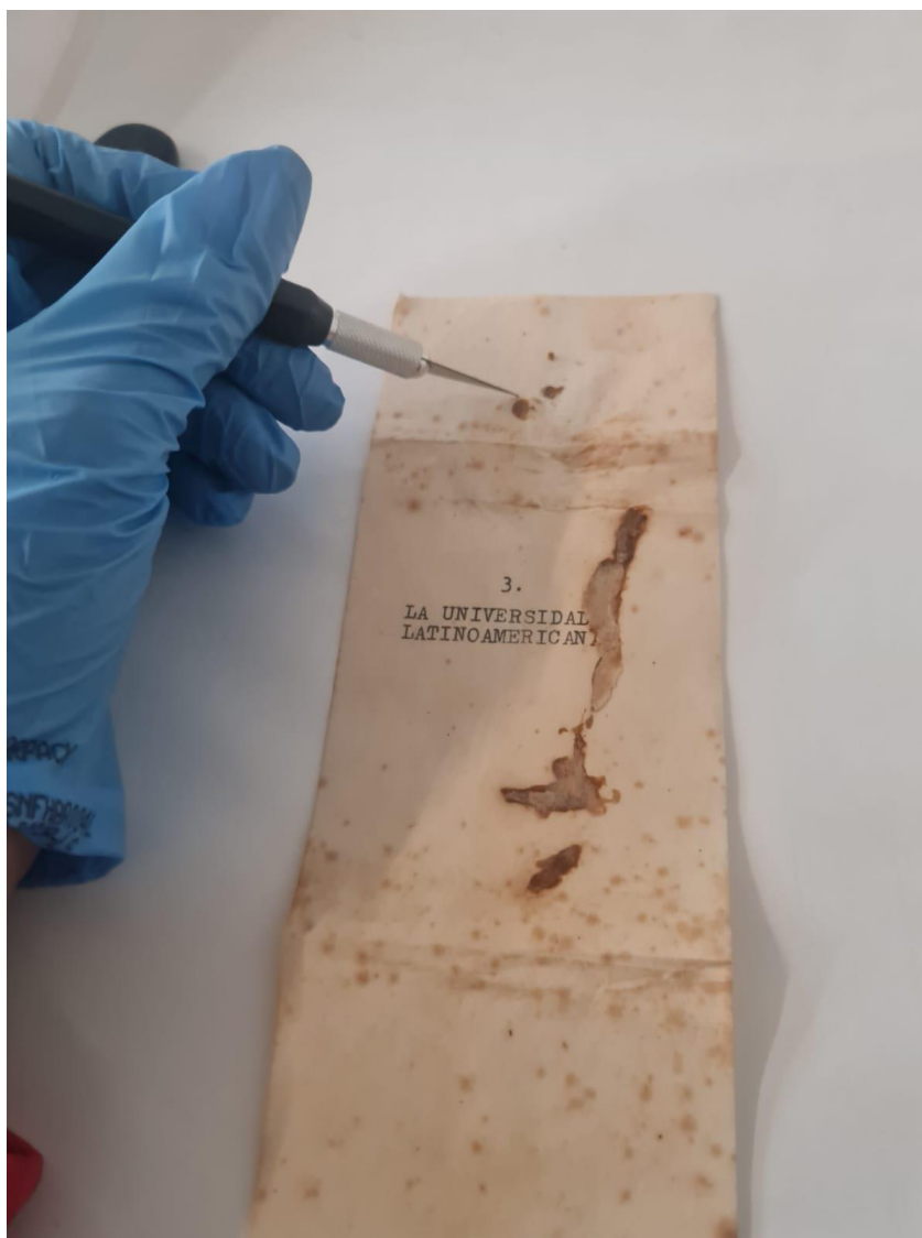
Imagem 2: Documento sendo higienizado

Para a realização deste trabalho, foram utilizados os materiais adquiridos no projeto anterior pelo Arquivo Central (ACE) e Diretoria de Difusão Cultural (DDC), tais como: Materiais para higienização e acondicionamento dos documentos: 3 trinchas; 3 trinchas com cerdas leves; 6 jalecos; 10 caixa de máscaras; resma A3 para confecção de camisetas; 10 cartolinas brancas; pacote de clips de plástico ou metal não oxidável; e materiais de proteção individual, tais como luvas, jalecos, máscaras e óculos.