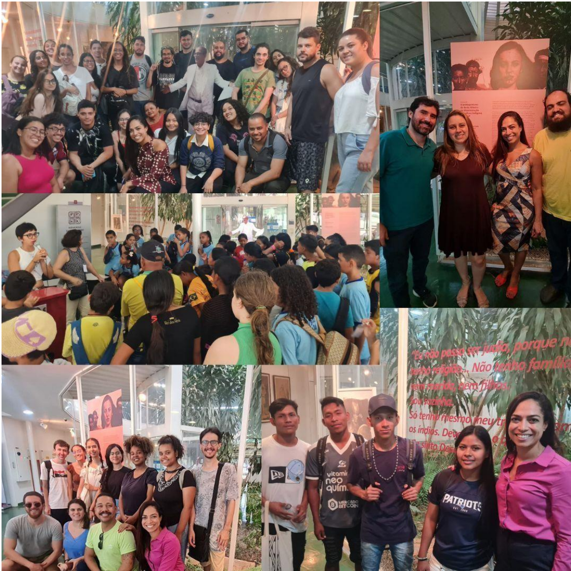
Imagem 8: Semana Universitária – Visitas guiadas durante o período da Exposição