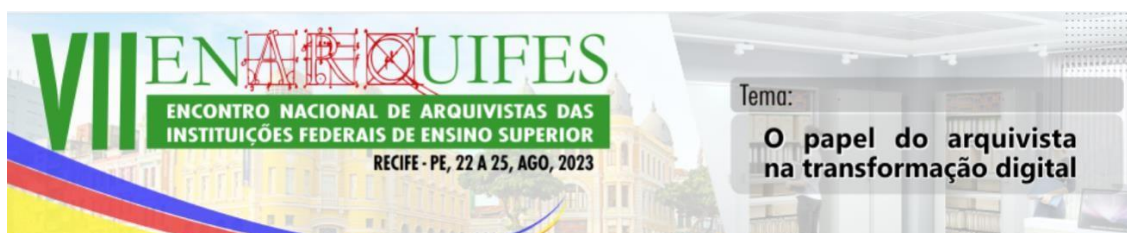
Imagem 6: Chamada para ENARQUIFES 2023

Na ocasião do VII Encontro Nacional dos Arquivistas das Instituições Federais de Ensino Superior (Enarquifes), realizado entre os dias 22 a 25 de agosto de 2023, ocorrido na cidade de Recife, cujo tema central foi “O papel do Arquivista e a transformação digital” foi aprovado o resumo que trata sobre o projeto e a experiência de disseminação dos acervos de Darcy e Berta Ribeiro, por meio do AtoM-UnB.