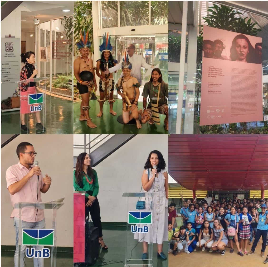
Imagem 7: Exposição – O protagonismo de Berta Ribeiro na disseminação da cultura Indígena no Brasil