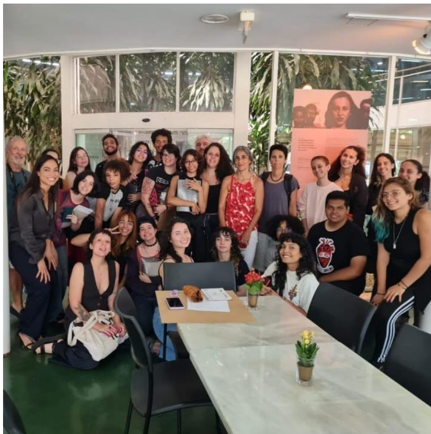
Imagem 13: Recepção de alunos do curso de Artes.

9.5 Aproximadamente 30 alunos do Curso de Graduação de Arquivologia.