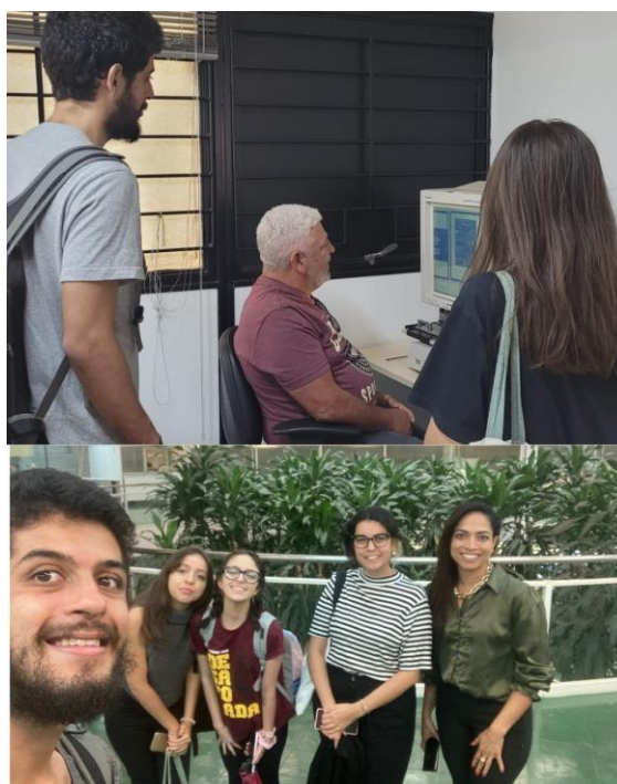
Imagem 1: Algumas fotos da etapa de treinamento