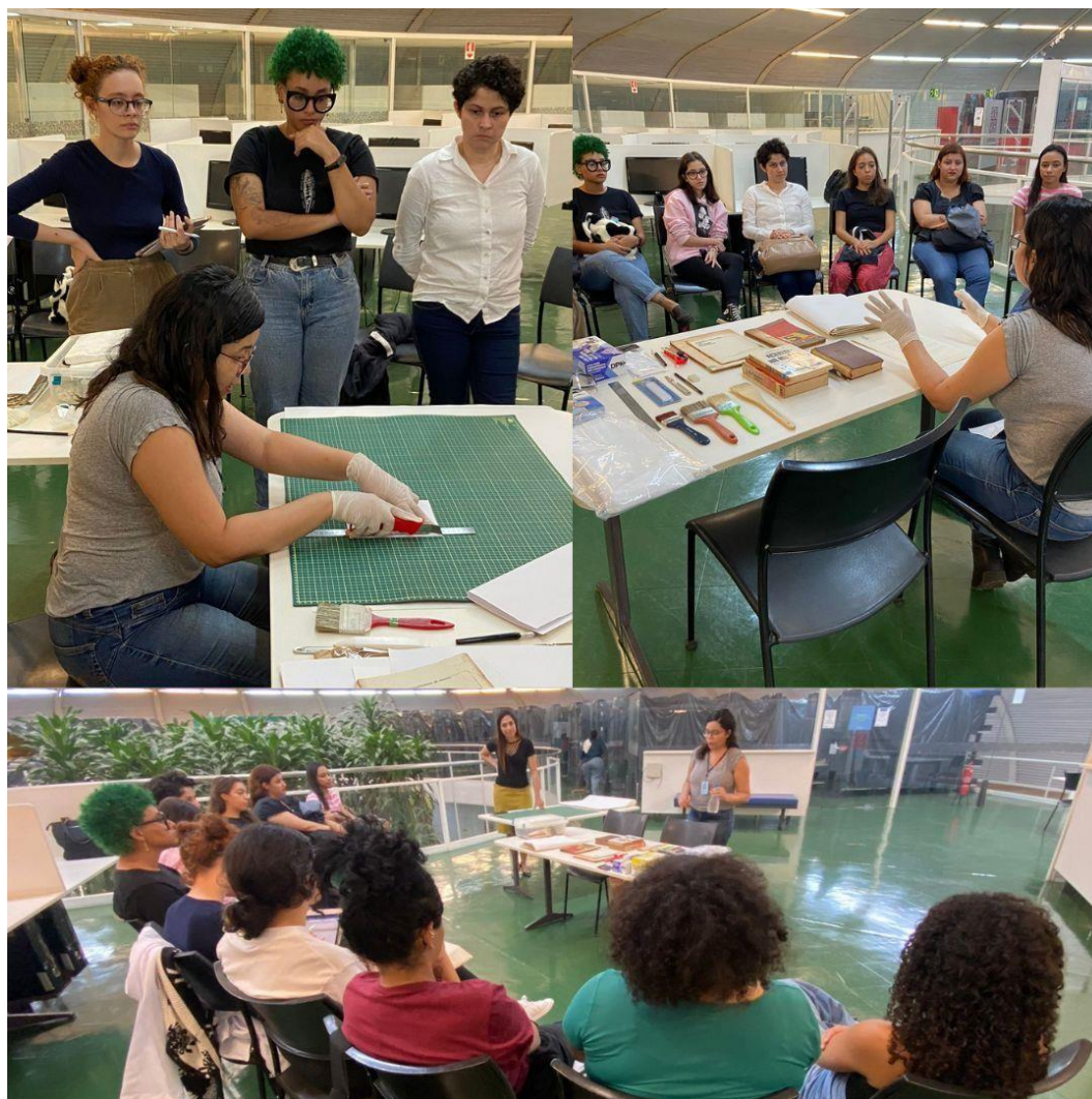
Imagem 3: Treinamento de conservação e higienização de livros e documentos

treinamento sobre higienização de obras bibliográfica e documentos de arquivo, utilizando de técnicas de conservação preventiva que possibilitam prolongar a vida dos documentos.