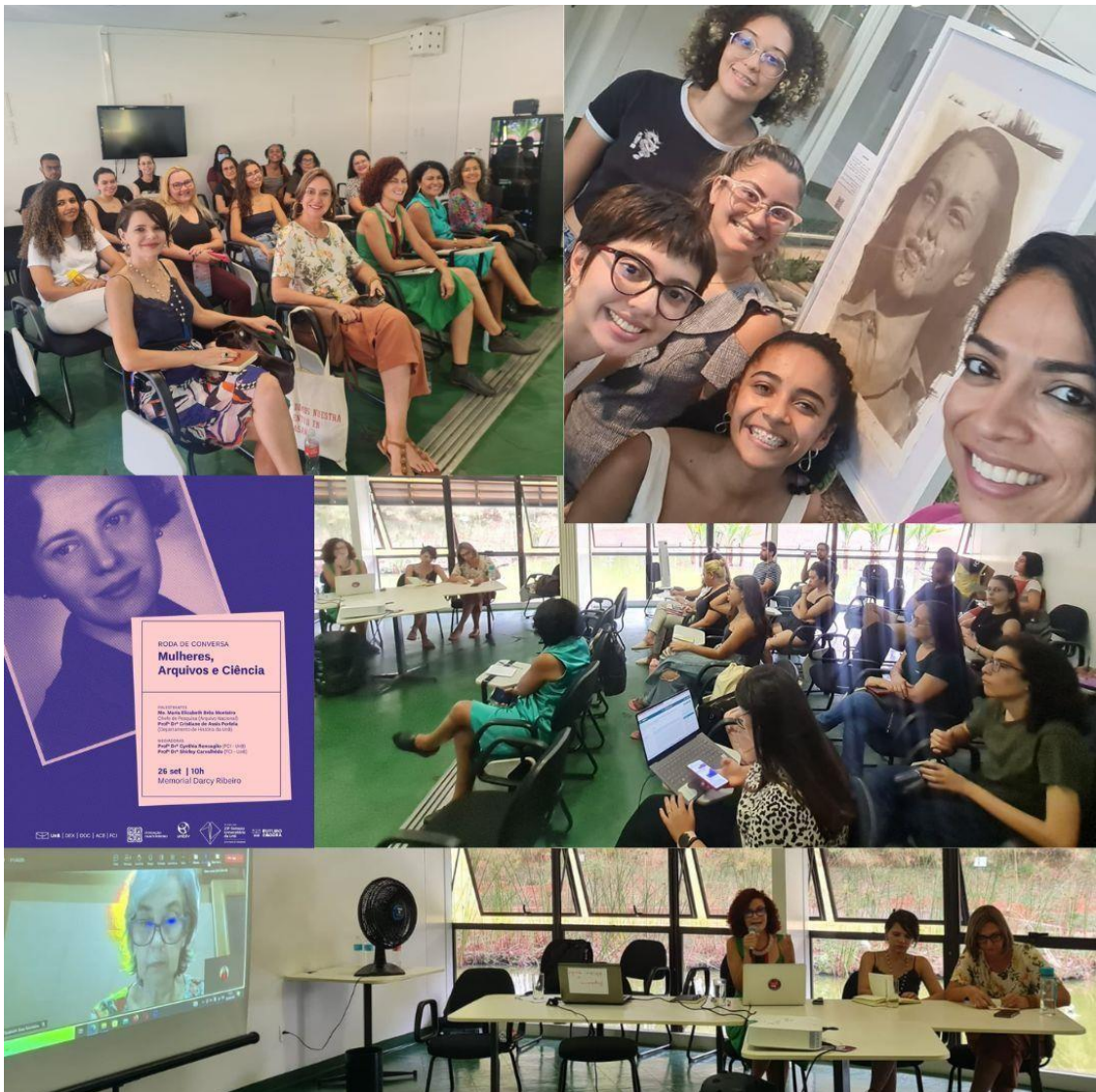
Imagem 9: Evento: Mulheres, Arquivos e Ciência

Franco. Tivemos a presença de aproximadamente 30 pessoas. Segue o link com a gravação da atividade: https://arquivocentral.unb.br/noticias/150-roda-de-conversa .