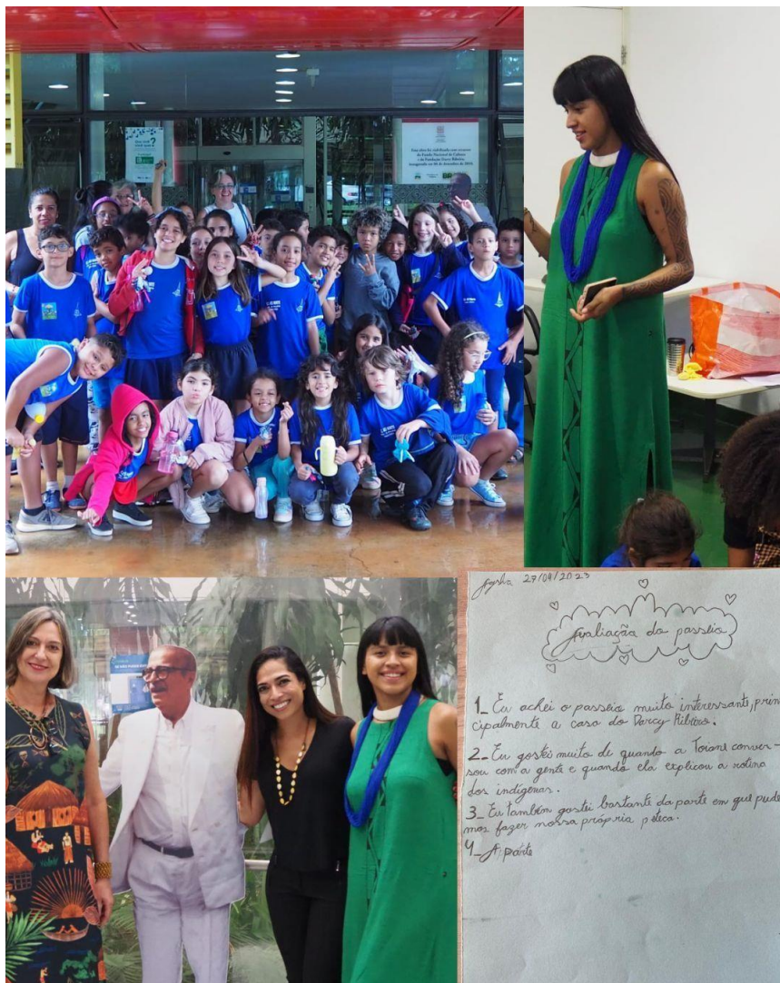
Imagem 5: Evento: Arquivos, Memórias e Saberes Indígenas